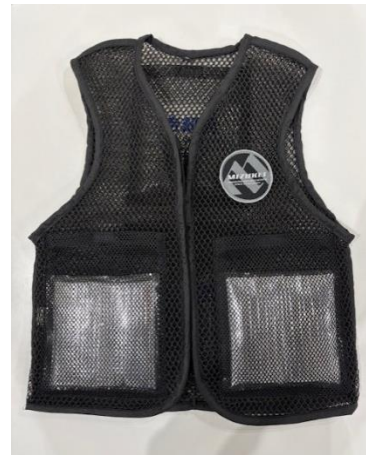
配布したリストバンドと冷却ベスト（写真はメーカー資料より抜粋）

当社はこれまで、商業施設、ホテル・レジャー施設、オフィスビル、住宅など、さまざまな施設における設備管理、環境衛生、保安警備、建物の維持・保全・修繕業務を担い、“裏方”として、施設を利用される方々の日常を支えて参りました。建物や設備は、年月とともに老朽化していくため、サービスを可能な限り停止させることなく安定運用を継続するには、専門知識に基づく継続的な点検と、故障発生時の迅速かつ的確な緊急対応が不可欠です。